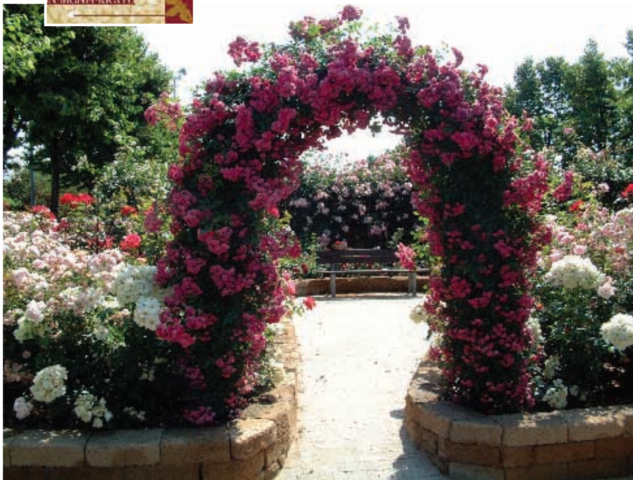
"Coniolo" di G. Morra

Dal 14 al 29 maggio 2005 un'occasione perfetta e "intrigante" per visitare e vivere il Monferrato Casalese