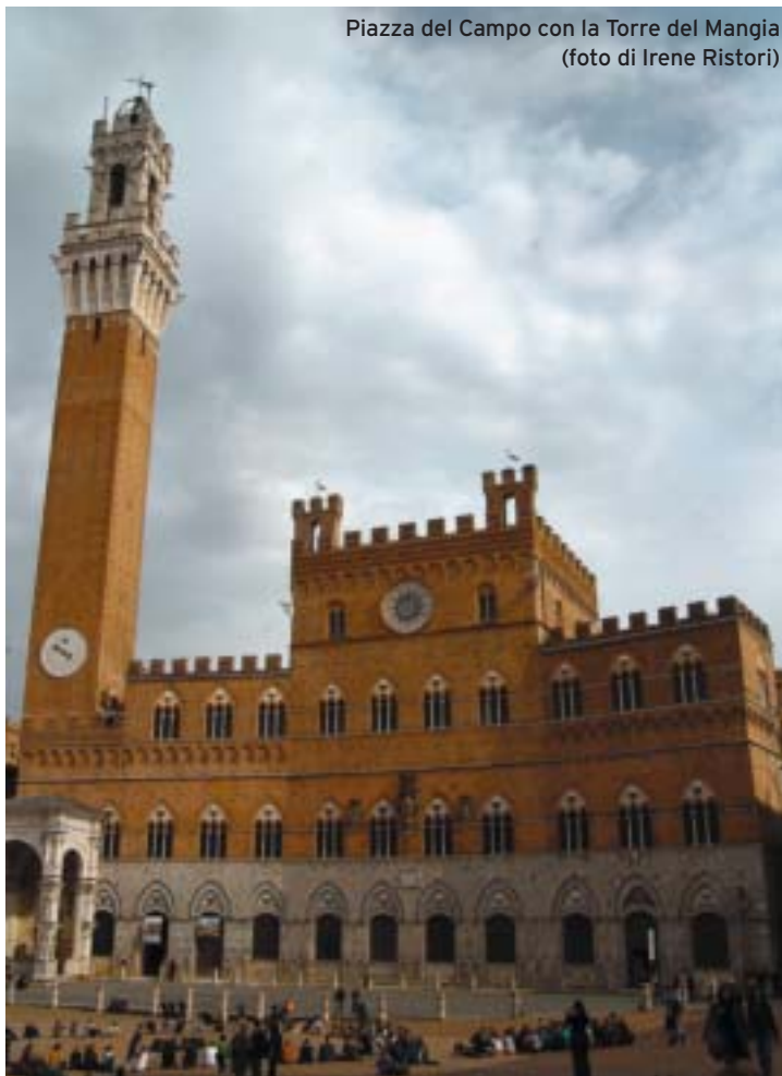
Piazza del Campo con la Torre del Mangia