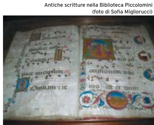
Antiche scritture nella Biblioteca Piccolomini