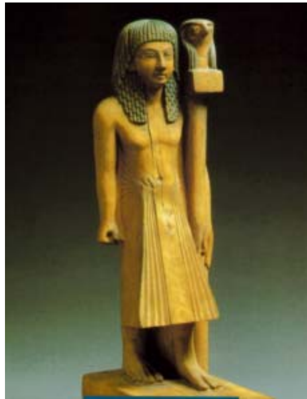
Veste maschile pieghettata