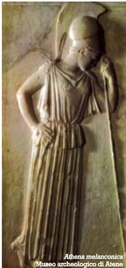
Athena melanconica Museo archeologico di Atene