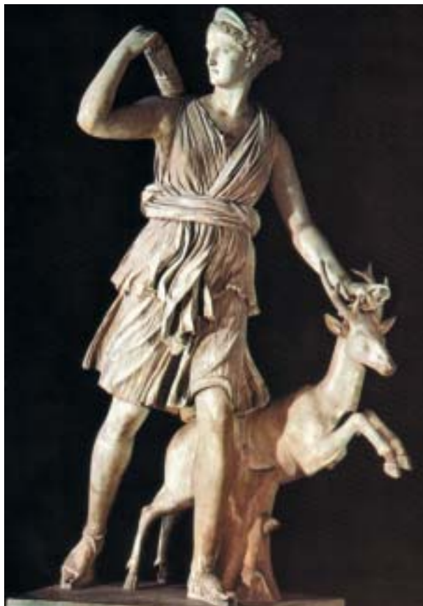
Modello di cintura

Un modo molto particolare di annodare una cintura consisteva nel formare un otto e infilare le braccia nei due cerchi, come da figura. La cintura, inoltre, poteva essere incrociata sia sul davanti che sul dietro. Questo permetteva di tenere fermo il drappoggio, nella cui tecnica i Greci eccellevano.