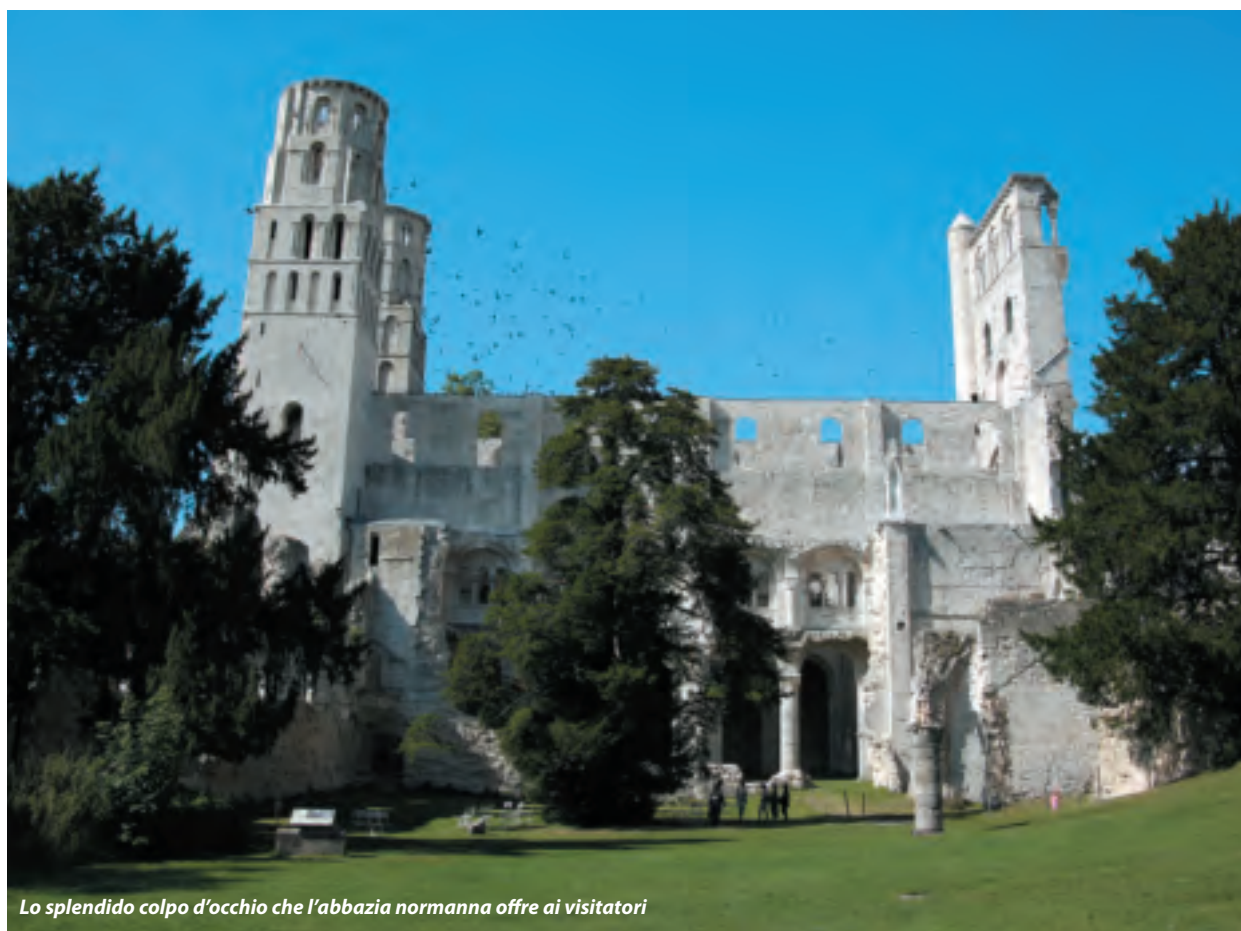
Lo splendido colpo d'occhio che l'abbazia normanna offre ai visitatori

Un plauso va all'amministrazione locale che è riuscita a effettuare un intervento di restauro prettamente conservativo, mettendo al sicuro le rovine dal degrado, senza per questo inficiare in alcun modo la prospettiva dell'abbazia.