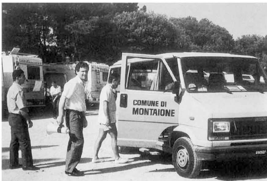
Montaione (FI) Il pulmino messo a disposizione dal Comune per i non normodotati.

Ignorando l'argomento in discussione contesta al COORDINAMENTO CAMPERISTI di non