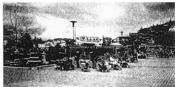
La mostra di attrezzature per il campeggio e il tempo libero