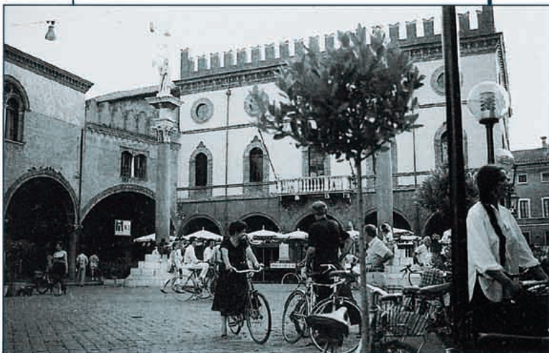
Ravenna: Piazza del Popolo con scorcio del Palazzo Comunale e il Palazzo Veneziano

Le botteghe artigiane (attenzione però ai