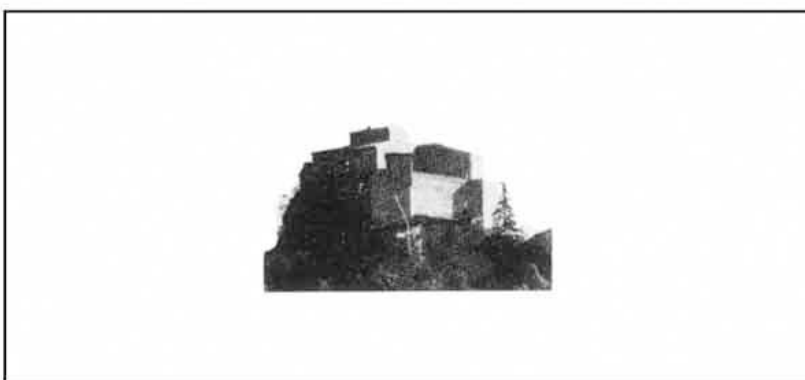
Il castello di Rossena

I luoghi da visitare intorno a Canossa sono innumerevoli: castelli e borghi medievali accompagnano la visita e sono parte integrante di un paesaggio che conserva ancora le antiche