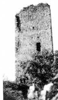
Una parte dei resti del castello

All'alba la rupe era là, a dominare la pianura, con tutti i suoi terribili dirupi.