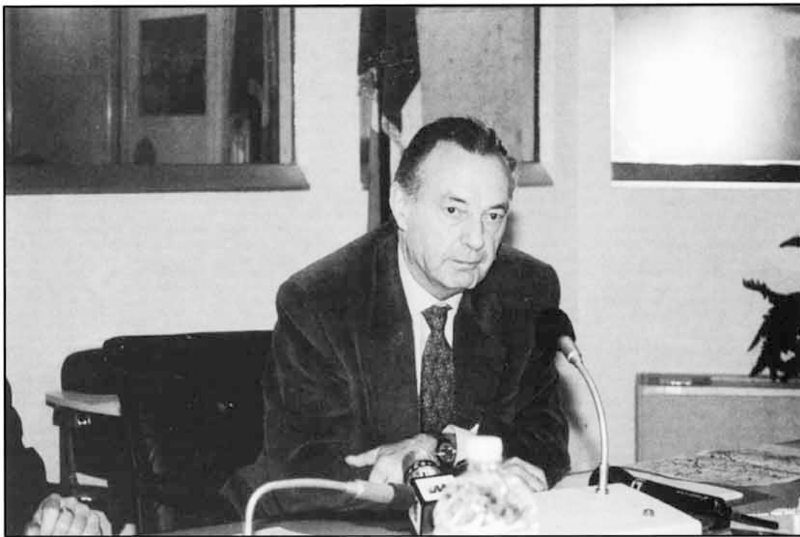
Senatore Franco Barberi

Nel prossimo numero affronteremo la Regione Marche pubblicando la corrispondenza da e per l'Assessore al Turismo e i riscontri dei comuni interessati ai finanziamenti erogati dalla regione.