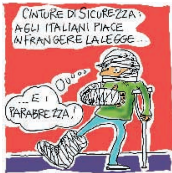
Da una vignetta di Joshua Held

F alliscono le Campagne di Prevenzione perché il cittadino si sente trattato da suddito allorché vede le Forze di Polizia non fermare e contravvenzionare gli autisti degli enti pubblici e/o dello Stato e/o similari che viaggiano regolarmente senza le cinture di sicurezza allacciate. Questa situazione attiva la sfida a chi è più furbo e chi ci rimette è tutta la collettività. Per quanto sopra, prima di spendere altri soldi in Campagne di Prevenzione, il Governo in carica cominci a far dare il buon esempio dai dipendenti degli enti pubblici e/o dello Stato e/o similari, stangando chi non si adegua ad una simile importante prescrizione.