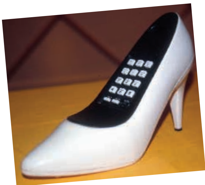
Oggetti in mostra edizione 2003

Da sabato 13 marzo inizia la sesta edizione della mostra che ha per protagonisti oggetti... ai confini del gusto