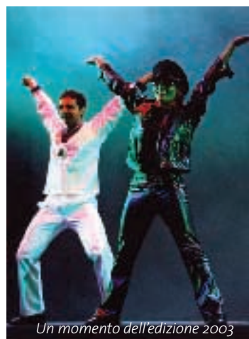
Un momento dell'edizione 2003

L'ingresso è di 7,5 euro ed è gradito un abbigliamento consono alla serata.