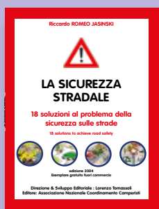
LA SICUREZZA STRADALE Autore Riccardo Romeo Jasinski Progetto grafico Andrea Biancalani Anno di pubblicazione 2004 Pagine 96