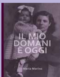
IL MIO DOMANI È OGGI Autore Maria Marino Progetto grafico Annarella Valenti Anno di pubblicazione 2017 Pagine 48