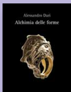
ALCHIMIA DELLE FORME Autore Alessandro Dadi Progetto grafico Andrea Biancalani Anno di pubblicazione 2009 Pagine 192