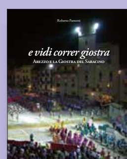
E VIDI CORRER GIOSTRA Autore Roberto Parnetti Progetto grafico Andrea Biancalani Anno di pubblicazione 2006 Pagine 225