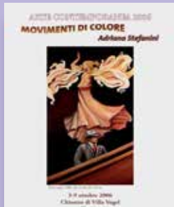
MOVIMENTO DI COLORE Autore Adriana Stefanini Progetto grafico Andrea Biancalani Anno di pubblicazione 2006 Pagine 16